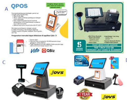
Gambar 3. Empat alternatif mesin kasir

Tim pelaksana mencari beberapa alternatif mesin kasir, seperti ditampilkan di Gambar 3. Terdapat 4 alternatif mesin kasir pintar, yang menggunakan teknologi digital. Alternatif tersebut dikomunikasikan kepada mitra untuk menyesuaikan dengan kebutuhan dan kondisi. Akhirnya ditetapkan bahwa alternatif B yang dipilih.