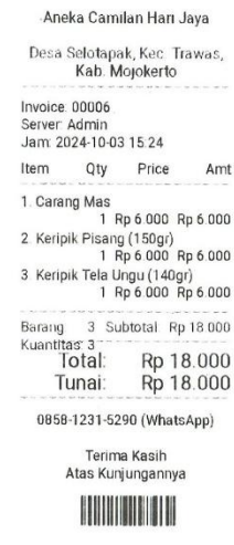
Gambar 6. Penggunaan teknologi mesin kasir pintar pada penjualan riil