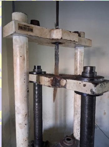
Gambar 3. 1 Proses Pengujian Tarik Bilah Keris pada UTM

Perlu dicatat bahwa dalam penelitian ini, pengujian tarik dilakukan pada bilah keris secara penuh (full blade), bukan pada spesimen dog-bone standar ASTM E8/E8M. Hal ini karena tujuan penelitian adalah mengevaluasi performa mekanik bilah keris dalam kondisi aktual penggunaannya. Bilah keris dipasang pada mesin UTM menggunakan adaptasi grip kayu yang memungkinkan pencekaman yang aman dan konsisten. Luas penampang rata-rata yang diukur dengan jangka sorong adalah 160 \text{ mm}^2 dengan panjang jarak jepit 300 mm. Pendekatan ini memberikan perbandingan langsung antar kondisi pendinginan yang valid karena seluruh spesimen memiliki geometri dan kondisi pemasangan yang identik.