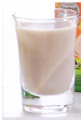
Gambar 2.2 Susu

Susu sapi merupakan sumber bahan makanan yang sempurna. Susu termasuk dalam empat sehat lima sempurna yang terdiri dari atas protein,